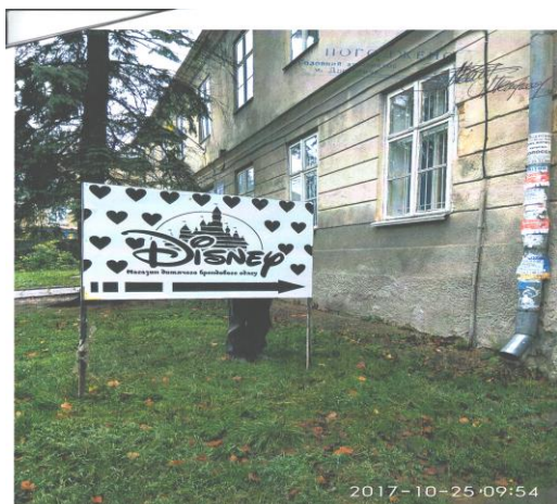
Додаток 6 (вул.Я.Осмомисла, 10)