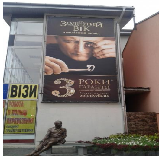
Додаток 2 (пл.Т.Шевченка, 1/1)