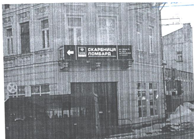
Додаток 7 (вул.І.Мазепи, 17)