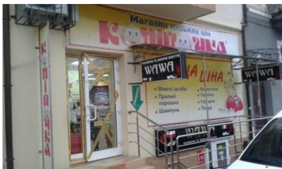
Додаток 3 (вул.Ковальська, 3)