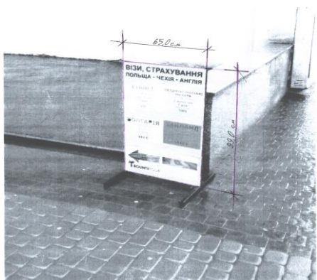
Додаток 8 (вул.І.Мазепи, 5)