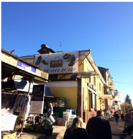
Додаток 1 (вул.Ш.Алейхема, 6)