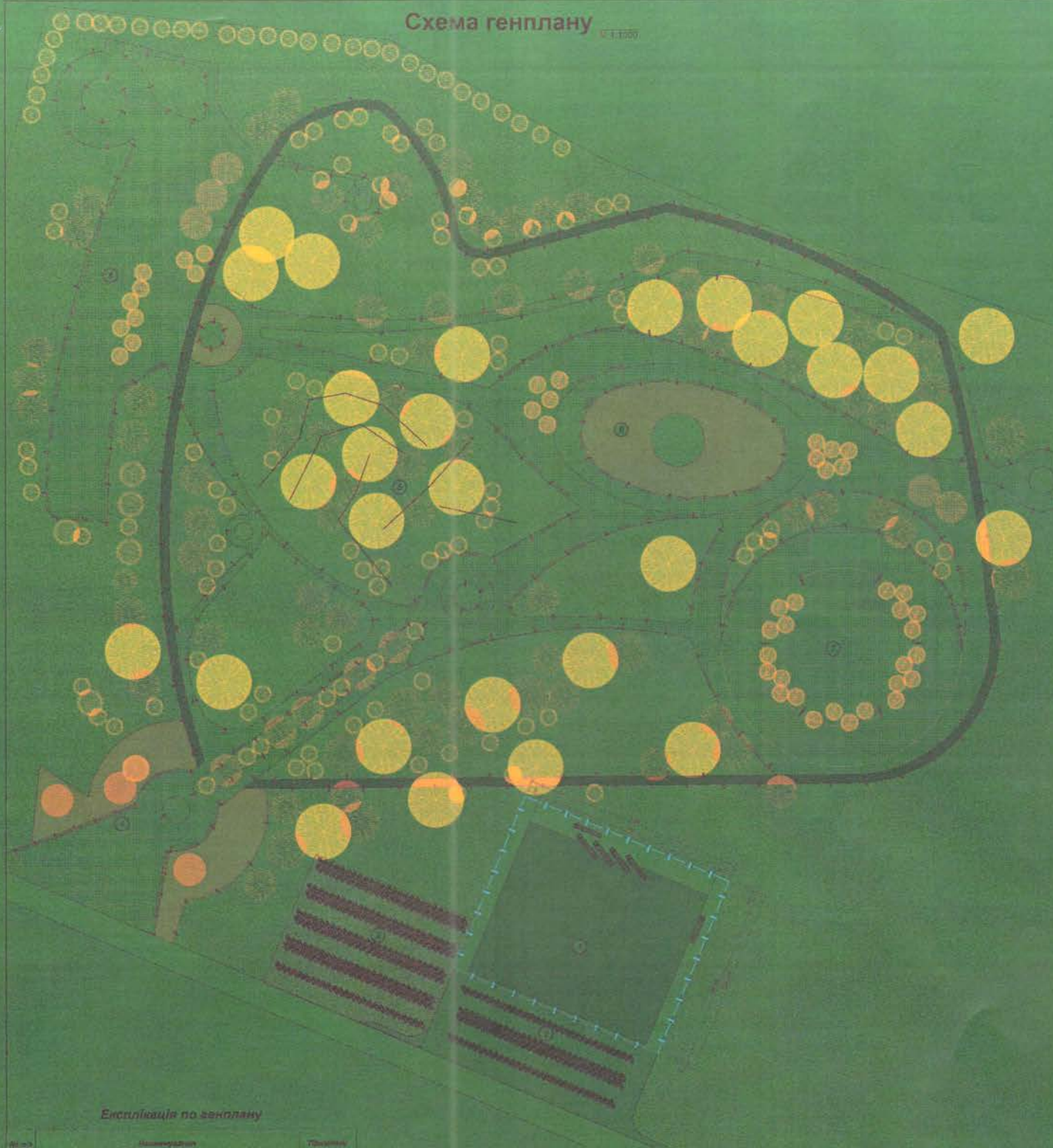
Схема генплану 1:1000